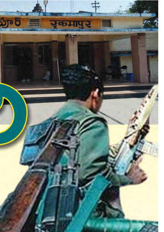
రుక్మాపూర్ రైల్వేస్టేషన్లో మావోయిస్టులు తలూకుతున్న కార్యక్రమం

లోతుగా విచారిస్తున్నారు. నిన్న మొన్నటి వరకు అడవి సముఖ్యులను వీరు, ఇప్పుడు ఇలా కూలీల వేషంలో పట్టుబట్టడం స్థానికంగా తీవ్ర చర్చనీయాంశమైంది. ప్రస్తుతం నిందితులను తదుపరి విచారణ నిమిత్తం ఉన్నతాధికారులు రహస్య ప్రాంతానికి తరలించినట్లు తెలుస్తోంది. జిల్లా పోలీసుల నిఘా వైఫల్యమా? ఈ సంఘటనతో జిల్లా ప్రజలు ఒక్కసారిగా కలవరానికి గురైనారు. స్థానికంగా తీవ్ర అలజడిని సృష్టించింది. ప్రత్యేకించి తెలంగాణ పోలీసులకు సవాలు విసిరినట్లుంది. కూలీలుగా చేరిన మావోయిస్టుల వద్ద ఎలాంటి ఆయుధాలు లేవని అనుకుంటున్న కల్లీలకు సీనియర్ పోలీసులు పట్టుకోగలిగారు. నలుగురిలో ఓ మహిళా సక్రమైతే కూడా ఉండటం గమనార్హం. సంఘ విఘ్నా శక్తులతో పాలు మావోయిస్టులు కూడా తాండూరు ప్రాంతాన్ని పెట్టెలాగా వాడుకుంటున్నారని తెలుస్తోంది. ఇంత భారతనున్నా పోలీసు వ్యవస్థ, నిఘా విభాగం పనితీరును పరిహసించడమేలా ఉదయనీ విమర్శలు వస్తున్నాయి.