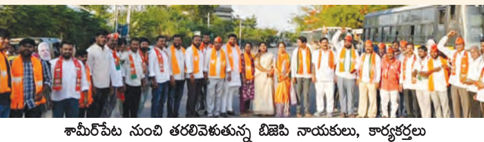
శామీర్ పేట నుంచి తరలివెళ్తున్న బిజెపి నాయకులు, కార్యకర్తలు

ప్రధాని మోడీ గర్జనను వినడానికి భారీగా తరలివెళ్లిన బిజెపి సైన్యం కాషాయమయమయిన రహదారులు దారిపాడవునా జై హో మోడీ నినాదాలు